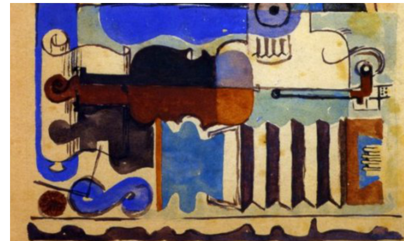
Immagine tratta da: Le Corbusier Nature morte à l'Accordeon, vers 1927-29

ASSOCIAZIONE CORO SANCTA MARIA DE EGRO Verbania Pallanza